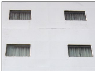
エバーミラクル塗装後12ヶ月