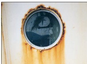
アクリル上塗塗装後12ヶ月