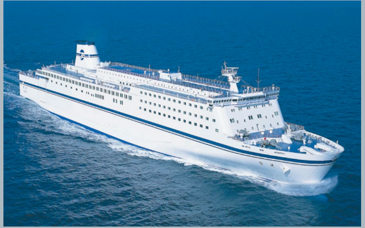
太平洋フェリー「きそ」に塗装